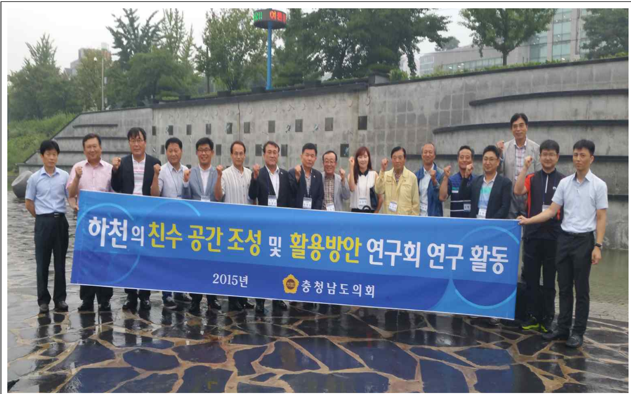
하천의 친수공간 조성 및 활용방안 연구회 선진지 견학 <유성천방문>