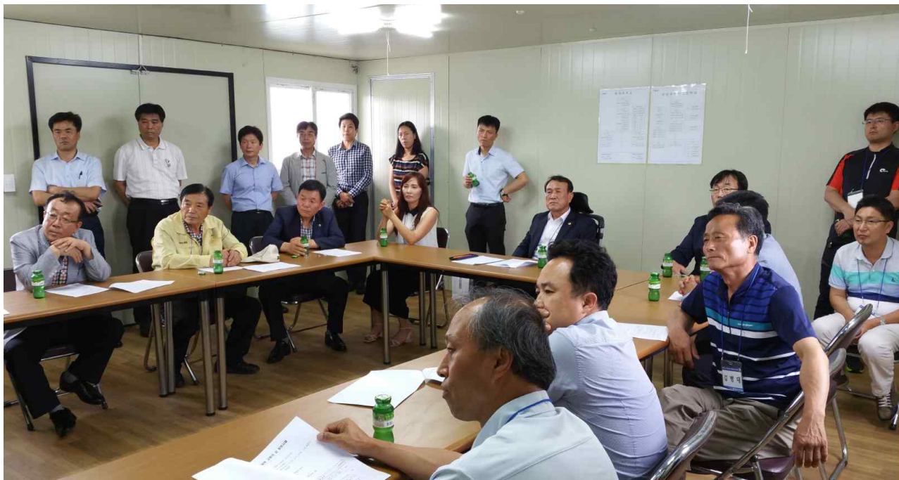
하천의 친수공간 조성 및 활용방안 연구회 선진지 견학 <무심천 현장사무실 추진사항 설명>