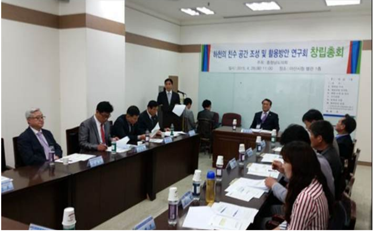
하천의 친수공간 조성 및 활용방안 연구회 창립총회