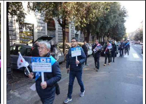
로마시내 거리 캠페인 (2)