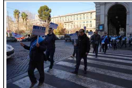
로마시내 거리 캠페인 (3)