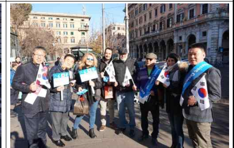
로마시내 거리 캠페인 (4)