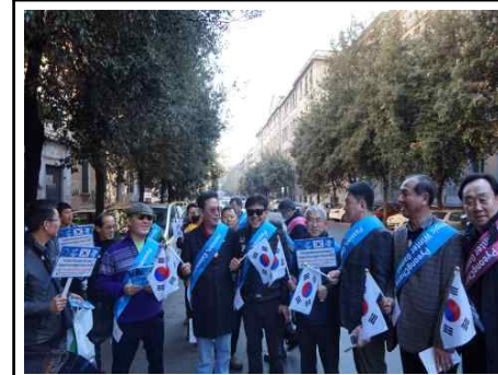
로마시내 거리 캠페인 (1)