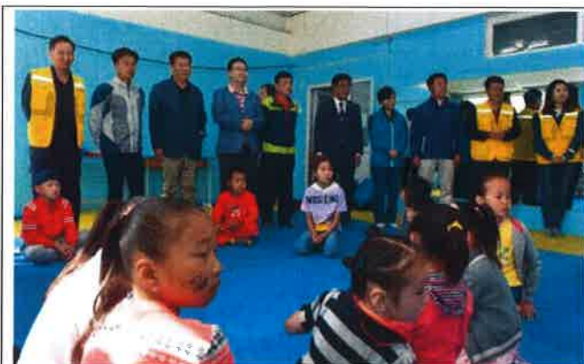
울란바토르 지역아동센터 방문(교육장)