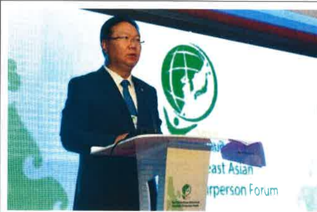
동북아의장포럼 주제 발표