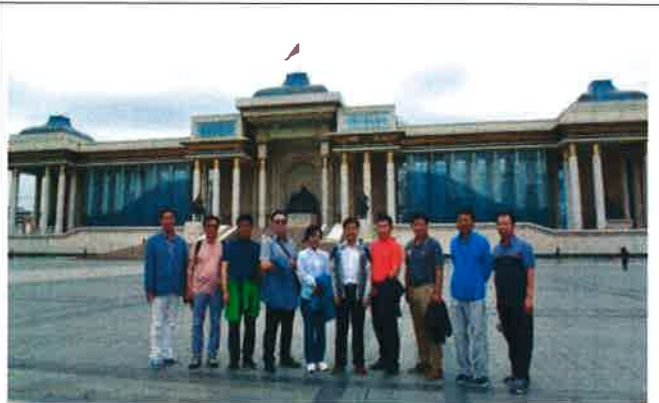
몽골 국회의사당 방문