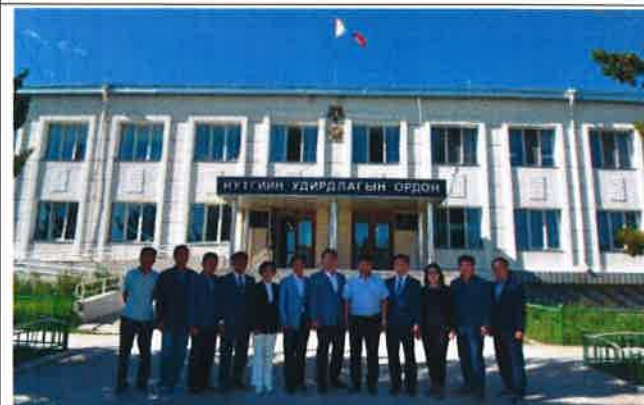
튜브도의회 방문(의회청사 앞)