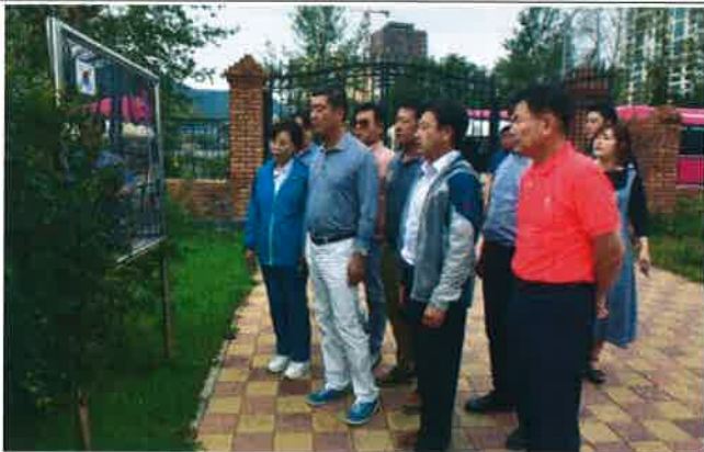
이태준열사 기념공원 방문