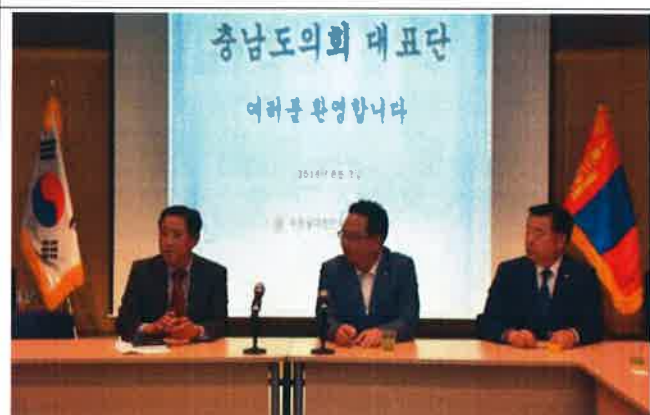
주몽골 대한민국 대사관 방문(간담회장)