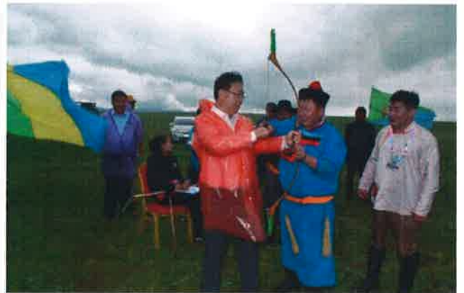
미니나담 경기 관람 및 체험