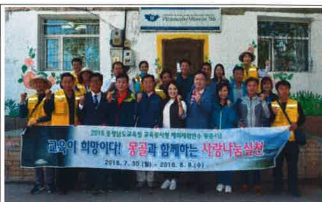
울란바토르 지역아동센터 방문(센터 앞)