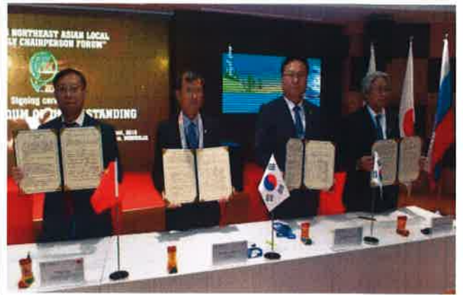
동북아의장포럼 양해각서 체결