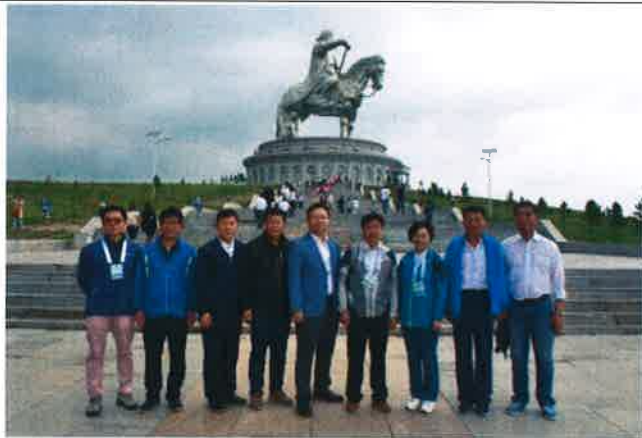
징기스칸 동상 관람