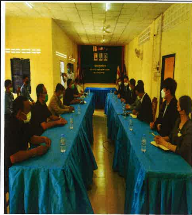
△ 계절근로자 MOU 관련 논의