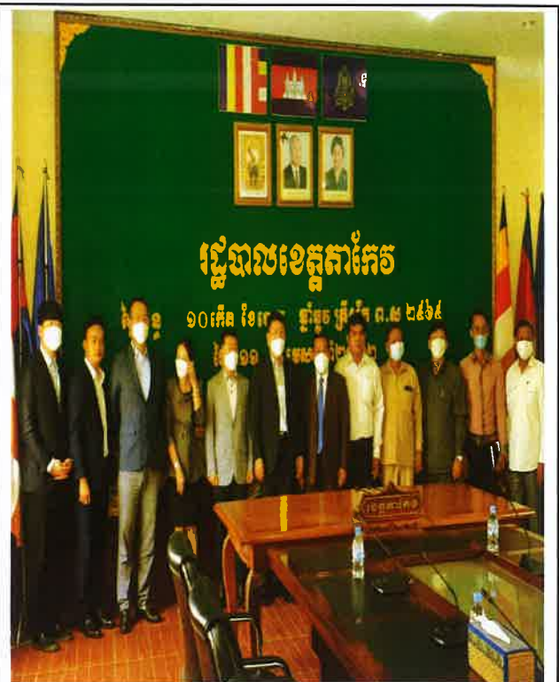
△ 타케오주지사과 기념사진