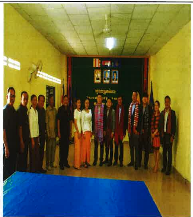
△ 타케오주지사와의 기념사진