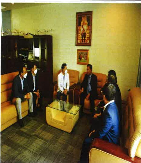
△ 장관과의 미팅