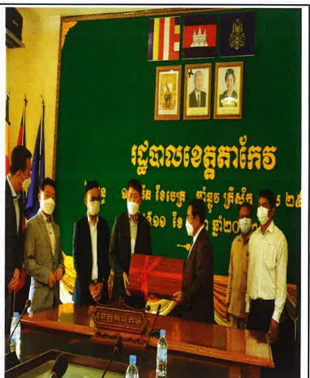
△ 타케오주 기념품 증정