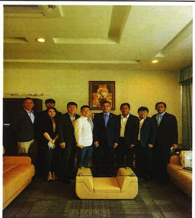
△ 장관과의 기념사진