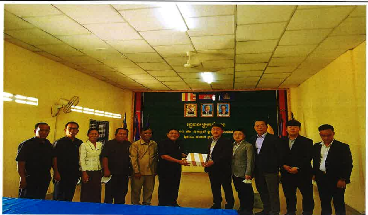
△ 기념품 증정