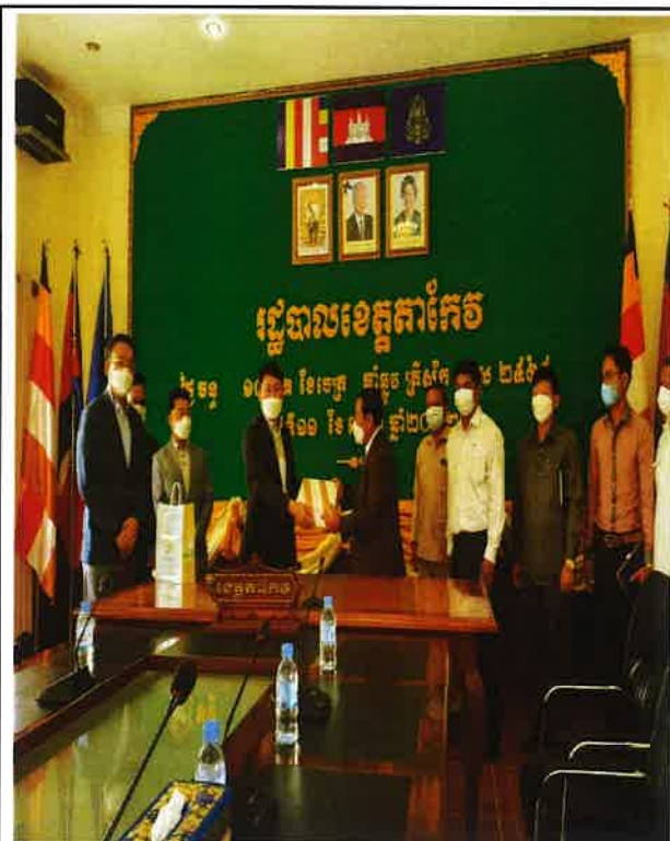
△ 아산시 기념품 증정