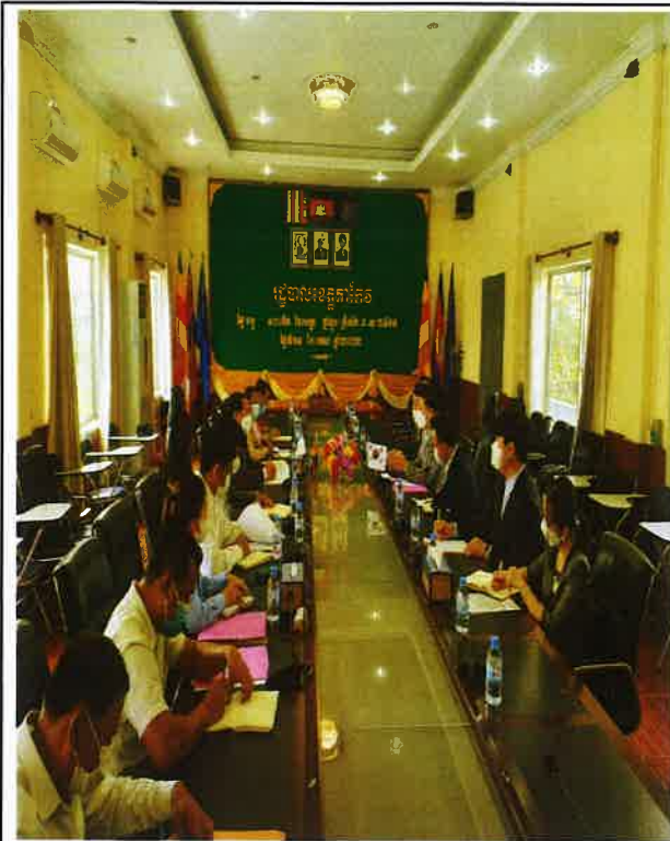
△ 계절근로자 MOU 관련 논의