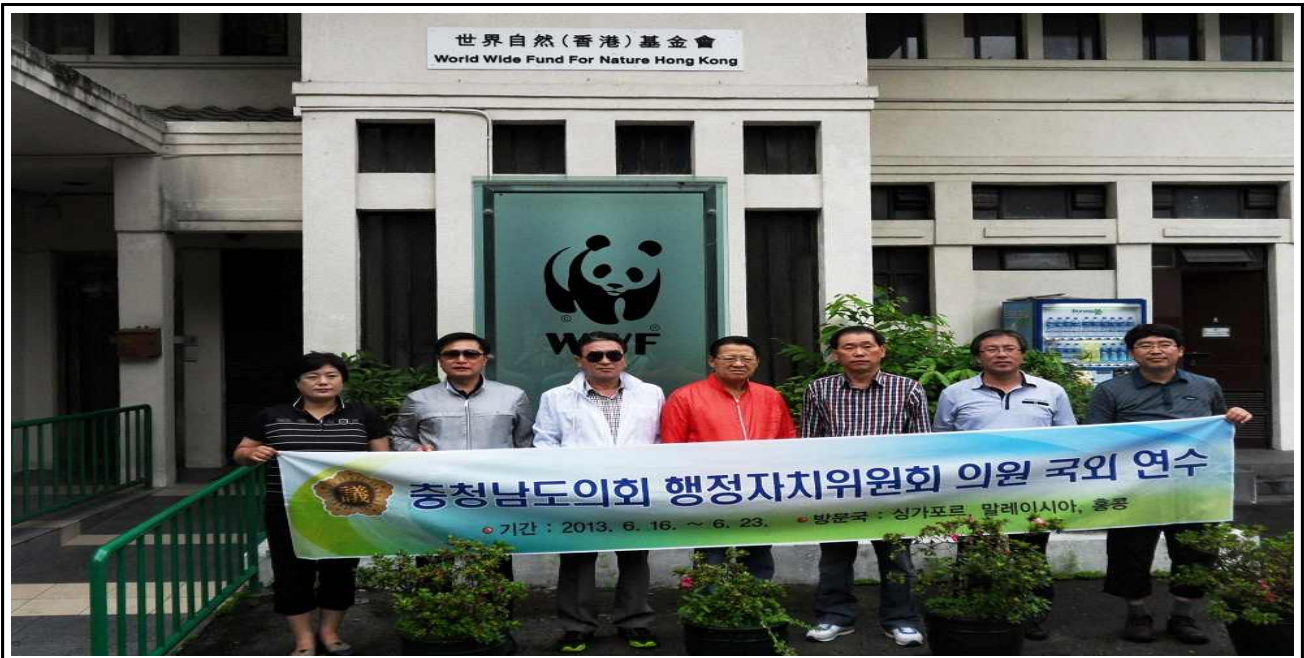
【마이포 습지 자연보호구역 방문후 기념촬영】