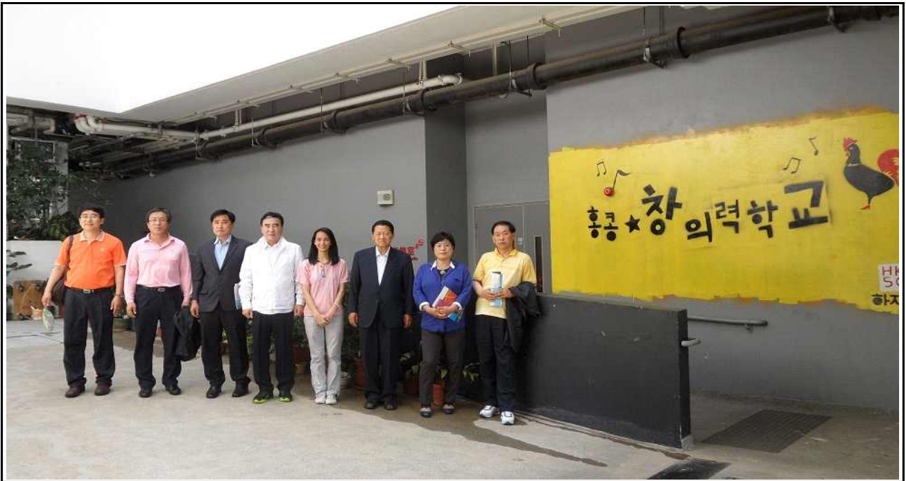
【홍콩 평생교육관련 창의력학교 방문 후 기념촬영】