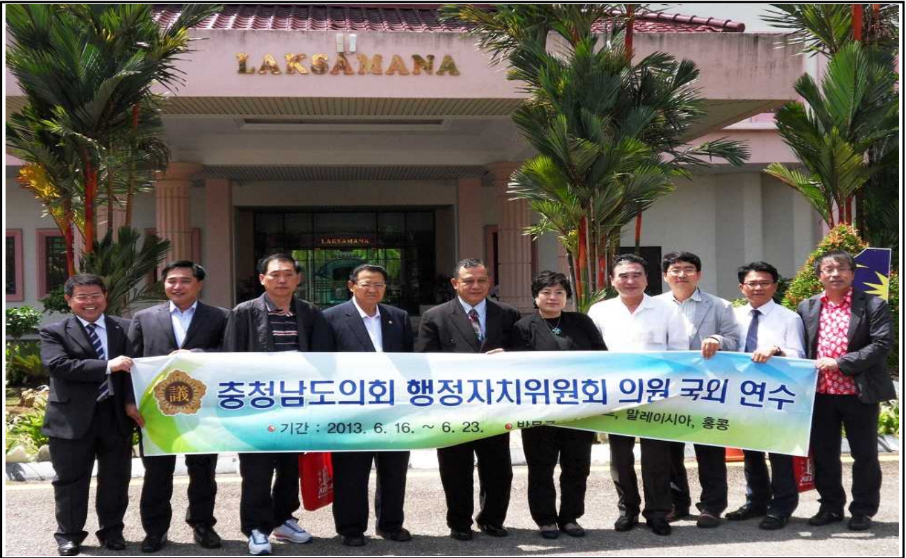
【말라카 시의회 방문 후 기념촬영】