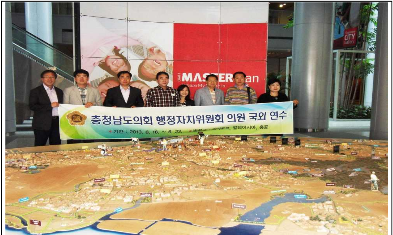
【도시개발청 보고청취 및 관계자와의 의견교환 후 싱가포르 도시 모형도 앞에서 기념촬영】