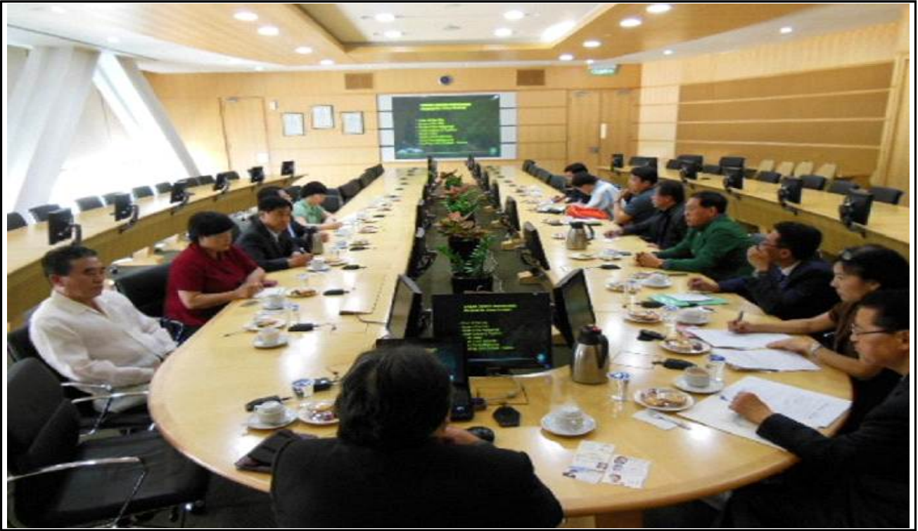
【푸트라자야 도시개발청 보고청취 및 관계자와의 의견교환】